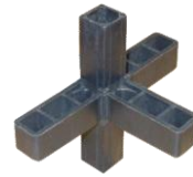
Peça Plástica Z