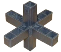
Peça Plástica S