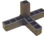
Peça Plástica Y