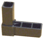
Peça Plástica W