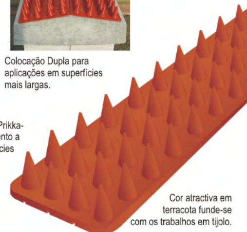
Cor atractiva em terracota funde-se com os trabalhos em tijolo.