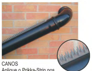
CANOS Aplique o Prikka-Strip nos canos externos de forma a tornar a sua propriedade ainda mais segura.