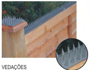
VEDAÇÕES A capacidade única de articulação dupla de Prikka-Strip adequa-se a qualquer superfície.