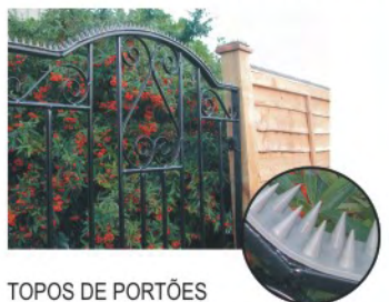
TOPOS DE PORTÕES Prikka-Strip faz com que os portões sejam ainda mais difíceis de poderem ser trepados.