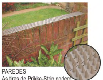
PAREDES As tiras de Prikka-Strip podem ser colocadas lado a lado para aumentar o seu efeito protector.