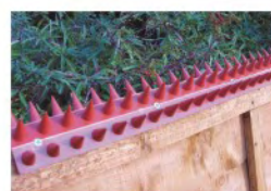
Vedações As tiras Prikka-Brick-Strip de articulação tripla podem ser aplicadas a vedações de forma a proporcionar igualmente uma protecção lateral.